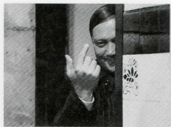
ユライ・ヘルツ所蔵