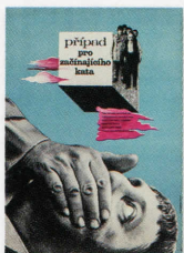
Artists: Eva Galová-Vodrářková 1969